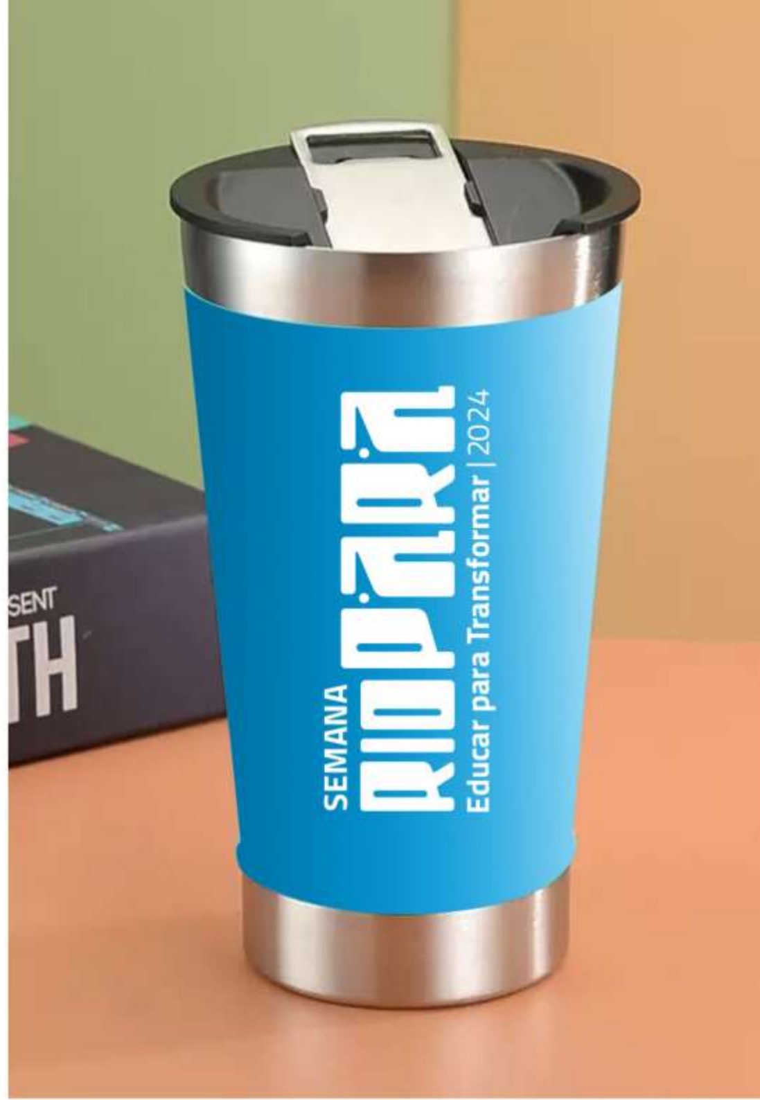
08 - Squeeze ou Copo Térmico