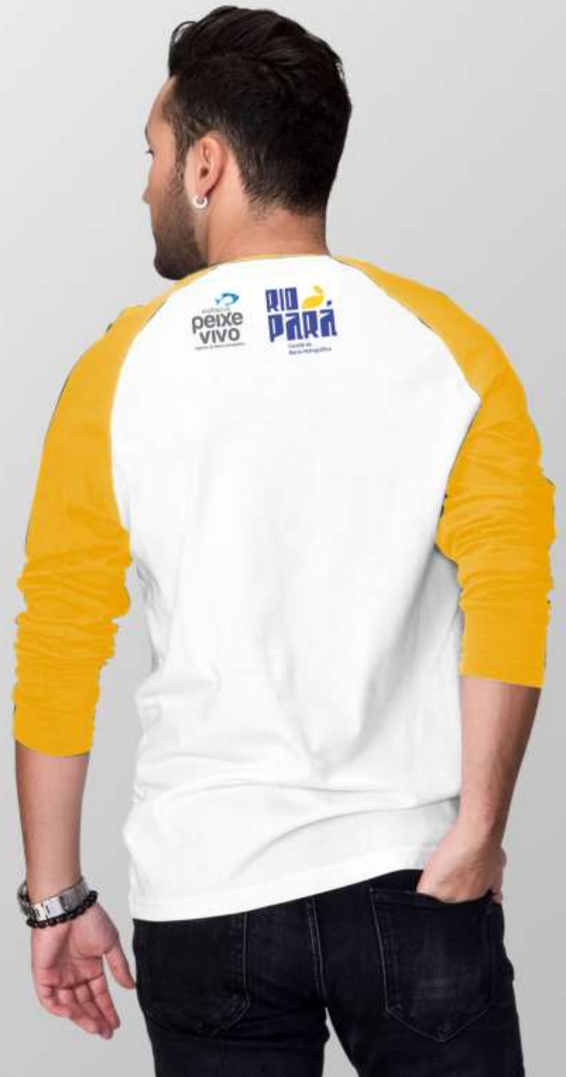
02 - Camiseta Manga Longa